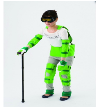
Atelier Manutention et port simulateur de vieillesse