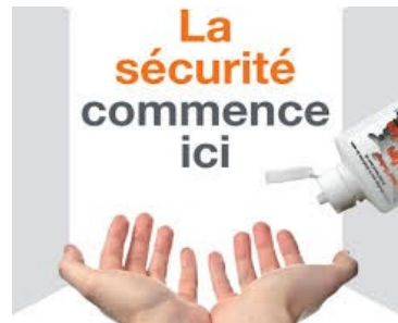
Atelier Hygiène des Mains