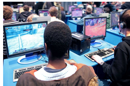
Atelier Serious Game