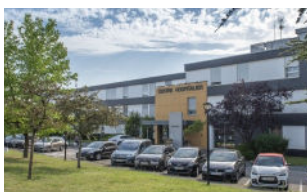
Entrée Pavillon Marie Curie

Lundi, mardi, jeudi, vendredi 9h00 - 12h00 / 13h40 à 16h40