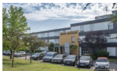
Entrée Pavillon Marie Curie

Secrétariat du lundi au vendredi de 9h à 17h au 02 54 03 54 15